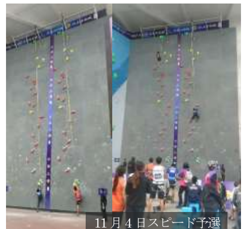
11月4日スピード予選