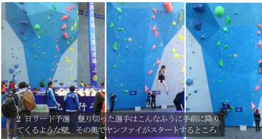
2日リード予選 登り切った選手はこんなふう到手前に降りてくるような壁。その奥でヤンファイがスタートするところ

動画はこちらをご覧ください https://web.facebook.com/angkorclimbersnet/?_rdc=1&_rdr