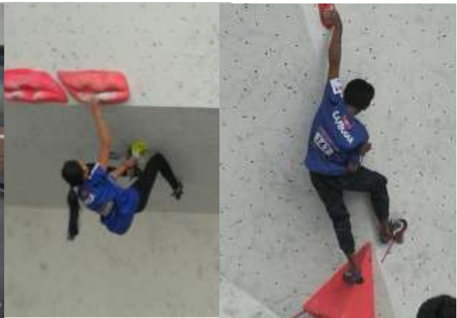
11月1日 ボルダリング予選

動画はこちらをご覧ください https://web.facebook.com/angkorclimbersnet/?_rdc=1&_rdr