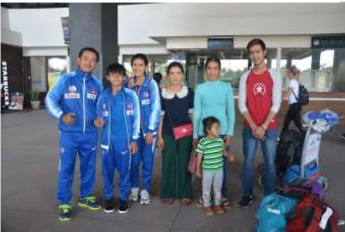
シムリアプ空港から出発

http://www.ifsc-climbing.org/index.php/world-competition/calendar#!comp=7707&cat=80