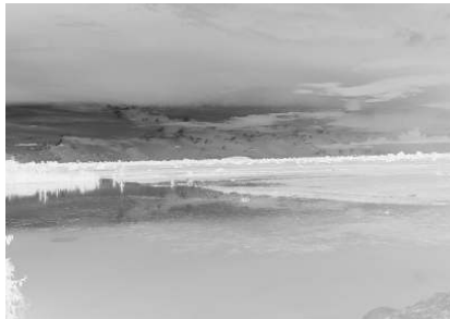
バスがシェムリアップに近づくと、朝から降り続けていた雨が止んだ。濡れた雲と淡い残照が調和して辺りは深遠な空気に包まれた