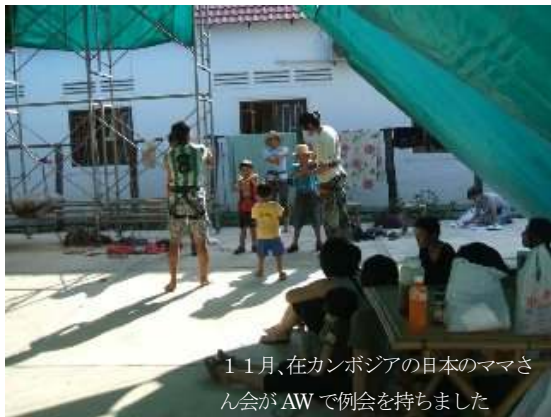
11月、在カンボジアの日本のママさん会がAWで例会を持ちました

概ね、毎週、土曜日と日曜日が利用出来ます。時間は、午前（8時～11時）と午後（3時～6時）に分かれます。ウィークデーにもオープンすることがあります。オープン/クローズの詳細予定はWebサイト（ www.angkorclimbers.net ）に掲載しています。