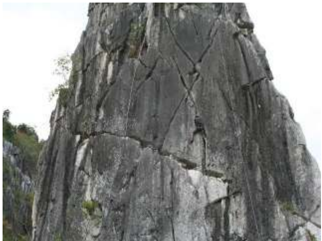
カンボット/コンボントラッチ、シャークスフィンタワーにて。