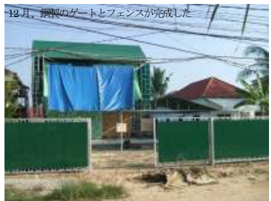
12月、鋼製のゲートとフェンスが完成した

・ Please understand our principle well, and safely enjoy the use of AW. Thanks.